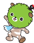
白神山地マスコットキャラクター ブナッキー