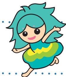
白神山地マスコットキャラクター ぶなみちゃん