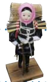
西目屋村の民芸品 「目屋人形」

ラフティングやカヌーの醍醐味はなんて言っても、遊歩道や林道からだと決して見られない場所から目屋溪谷を眺められる点。下から眺める目屋溪谷は、とても壮大ですよ。自然の中の一部になったような感覚になれます。大人も子どもも存分に楽しめるプログラムをご用意しています。水と戯れにお越しください。