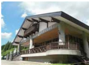
アクアグリーンビレッジ ANMON

お問合せ/0172-85-3011 住所/青森県中津軽郡西目屋村田代神田60-1