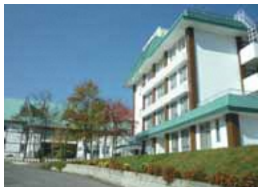
ホテルと温泉リゾート プナの里 白神館

温泉が自慢の宿泊施設。日帰り入浴も可能です。西目屋の特産品をふんだんに使ったお料理も宿泊客から好評です。