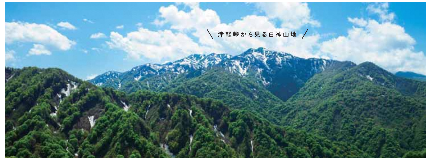
津軽峠から見る白神山地

青森県の南西部から秋田県北西部にかけて広がる白神山地。約13万haという広大なブナの原生林で、そのうち約1万7000haが1993年12月に日本初の世界遺産として登録されました。溪流沿いを進んでやっと出会える名勝・暗門の滝を目指すコースや、気軽に世界遺産のブナ林を歩ける散策道などで、白神山地の神秘的な魅力に触れられます。クマゲラやイスワシなど、学術的にも貴重な国の天然記念物も生息する手つかずの大自然を歩いてみませんか。